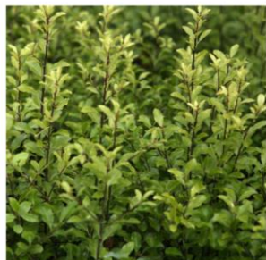
Pittosporum à petites feuilles 'Emerald Dome' - Pittosporum tenuifolium 'Emerald Dome'