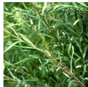
Saule à feuilles d'argousier - Salix elaeagnos 'Angustifolia'