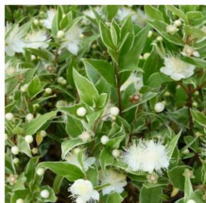
Myrte commune - Myrtus communis