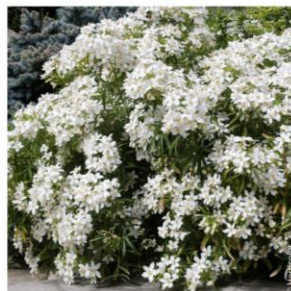
Oranger du Mexique - Choisya ternata