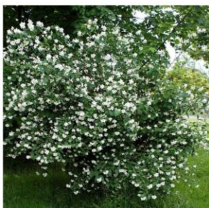
Seringat commun - Philadelphus coronarius