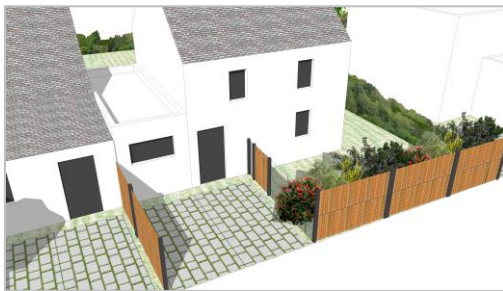
Illustration des places non closes : la clôture ne peut être implantée entre la voie de desserte et les stationnements, mais bien entre ces stationnements et le reste de la parcelle. Les places doivent rester ouvertes sur l'extérieur.

Il devra être aménagé par chaque acquéreur et à sa charge, au moins deux places de stationnement non closes et jointives, en plus du garage couvert éventuel.