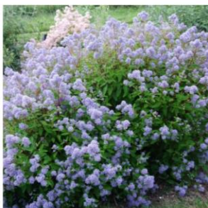
Céanothe, Lilas de Californie 'Victoria' - Ceanothus 'Victoria'