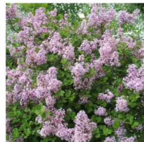
Lilas de Chine - Syringa meyeri