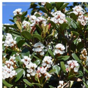
Raphiolepis umbellata - Raphiolepis umbellata